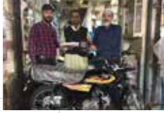
Rashid Khan Hyderabad