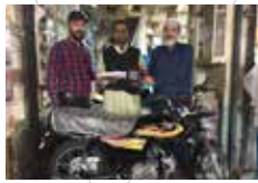
Rashid Khan Hyderabad