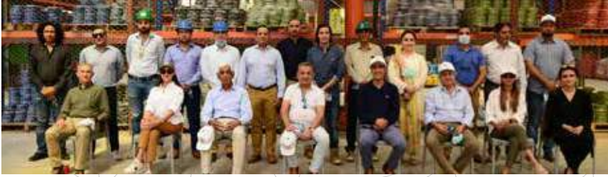
Group photo of the Board of Directors with Pakistan Cables staff members.